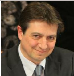
Pascal Bugis , maire de Castres, président de Castres-Mazamet